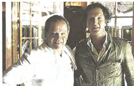
1. Zwei Kärntner in L.A.: Puck (li.) und Herold